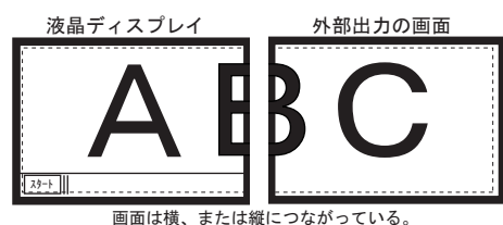
画面は横、または縦につながっている。

①の機種は特に問題ありませんが、②の機種では、初期状態では外部映像出力には壁紙しか表示されませんので、「画面に何も表示されない」、「画面が壁紙と同じ映像になる」など、本来映像が表示されているにもかかわらず映像が正常に表示されていないように見えることがあります。②の機種で、液晶の画面と外部出力の画面に同じ映像を表示したい時は、パソコン側の設定(「画面のプロパティ」の設定)を変更する必要があります。